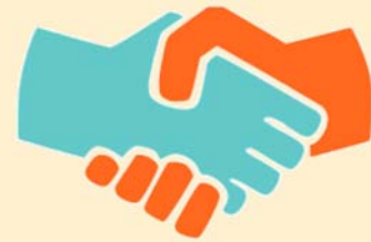
Contacto personal cercano, como tocar o dar la mano.