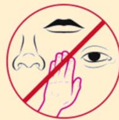
Tocar una superficie con el virus y luego tocarse la boca, la nariz o los ojos.