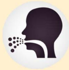
Toser o estornudar

Los expertos en salud aún están aprendiendo los detalles sobre cómo se propaga este nuevo coronavirus. Otros coronavirus se transmiten de una persona infectada a otras a través de: