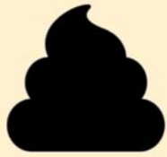
En casos raros, contacto con heces fecales.